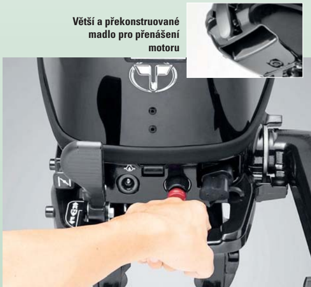
Větší a přestavované madlo pro přenášení motoru

Konstrukčně se jedná o jednoválcové čtyřtaky s objemem 123 cm 3 a hmotností 25 kg. S vrtulí 7 x 9" činí maximální otáčky 5 500 ot./min. Zapalování je typu CD s příčným sáním a chladicí systém řídí termostat. Nádrž na motoru má objem 1,1 litru, dá se však použít externí palivová nádrž o objemu 12 litrů.