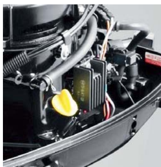
Pro plachetnice je jako pomocný pohon optimalizován model Tohatsu 6 Sail Pro, který má nohu s hřídelí dlouhou 20 nebo 25 palců a vrtuli uzpůsobenou vyššímu odporu a hmotnosti plachetnice. Tento motor je také standardně vybaven nabíjecím systémem 12 V/5 A včetně nabíjecího kabelu.