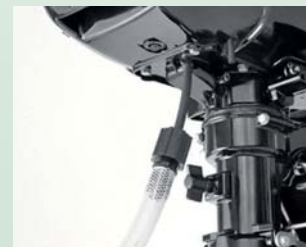
Každý majitel také ocení možnost napojit chladicí okruh na obyčejnou zahradní hadici a tímto způsobem jej jednoduše propláchnout.