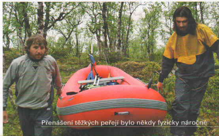
Přenášení těžkých peřejí bylo někdy fyzicky náročné

překonáváme, loď je opravdu rychlá. Přestože je naložená a kluci pádlují spíš symbolicky, jede opravdu svižně. U výtoku Naatamojoki z jezera kempujeme dva dny. Kluci rybaří a na je-