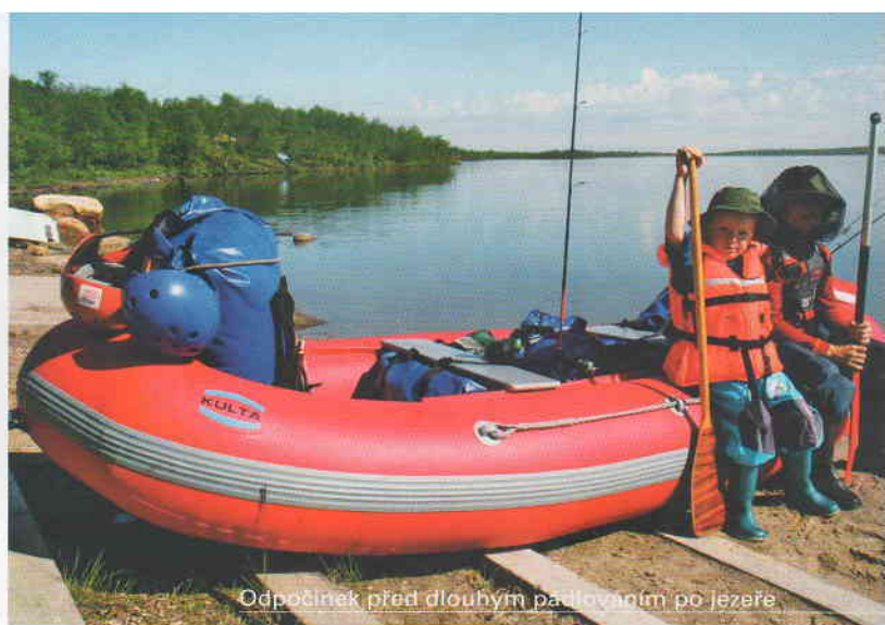
Odpočinek před dlouhým pádlováním po jezeře

Máme před sebou poslední den našeho putování. Od srubu se potřebujeme dostat k asi 15 km vzdálenému Sevettijärvi, kde parkujeme auto. Problém je, že těch 15 km vede částečně po skútrovce, částečně po vodních ramenech tekoucích podél cesty, částečně bažinami. To vše s nafouklým