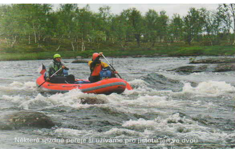
Některé slázné peřeje si užíváme pro jistotu jen ve dvou

jich nástrahy se nechalo zlákat několik krásných lipanů, a dokonce jeden losos.